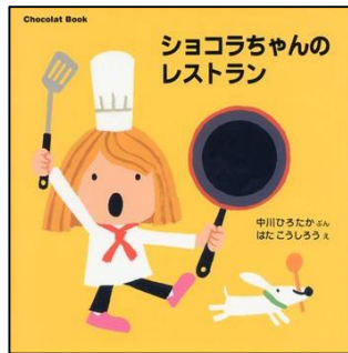
『ショコラちゃんのレストラン』 中川ひろたか／作 はた こうしろう／絵