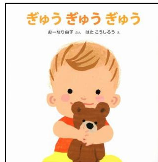
『ぎゅうぎゅうぎゅう』 おーなり 由子／作 はた こうしろう／絵

ショコラちゃんはお料理するのが大好き。 レストランはお客様でいっぱい。 大繁盛なレストランをのぞいてみてね。