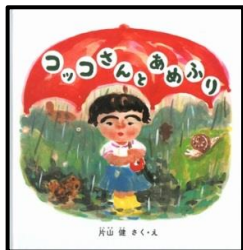
『こっこさんとあめふり』 片山 健 / 作・絵 出版社: 福音館書店

雨はなかなかやみません。コッコさんはてるてるぼうずを作ります。コッコさんのてるてるぼうずは宝物がつまります。コッコさんの願いはかないますか?