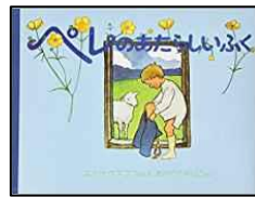
ペレのあたらしいふく 作：エルサ・ベスコフ