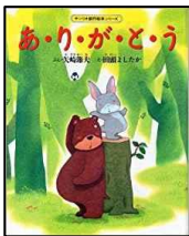
なかよくしてくれて あ・り・が・と・う 作：矢崎 節夫