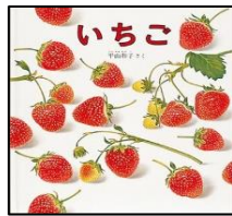
いちご 作：平山 和子