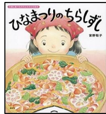
『ひなまつりのちらしずし』 宮野 聡子／作・画 出版社：講談社

もうすぐ春が来ます。 眠っている動物たちも次々とおきてきま すよ。くんくんくんくん、動物たちが感じる 春のにおいでどんななのでしょう。 白黒の絵で描かれいく絵本、 最後にポツと春の色があらわれます。