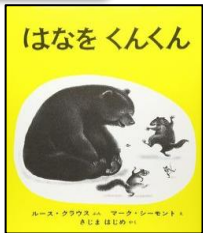
『はなをくんくん』 ルース・クラウス／文 マーク・シーモント／絵 木島 始／訳 出版社：福音館書店

もうすぐ春が来ます。 眠っている動物たちも次々とおきてきま すよ。くんくんくんくん、動物たちが感じる 春のにおいでどんななのでしょう。 白黒の絵で描かれいく絵本、 最後にポツと春の色があらわれます。