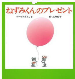
『ねずみくんのプレゼント』 なかえよしを 作 上野紀子 絵

雪が舞う寒い冬でも、家族で過ごすお家は、とてもあったかい。いわむらかずおさんの絵と言葉がほっこり心も暖かしてくれます。