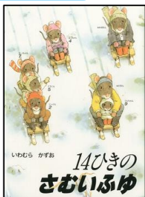
『14ひきのさむいふゆ』 いわむらかずお 童心社

雪が舞う寒い冬でも、家族で過ごすお家は、とてもあったかい。いわむらかずおさんの絵と言葉がほっこり心も暖かしてくれます。