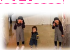
たくほくん3姉弟 かなとくん