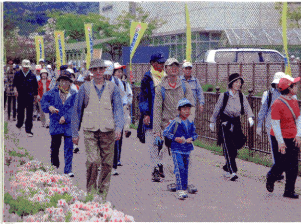
④大会には毎回多くの子どもたちも参加する