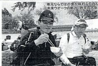
地元ならではの音が味わえるのも未来ウォークの魅力（昨年の大会）

今年には歩育コース（5*）も新設されました。打吹山でのネイチャーゲーム、歴史探訪など、親子で