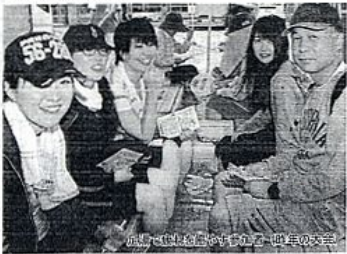
地元産品を味わった「昨年の大会」

このほか、倉吉パークスクエアやコースの途中には足湯があり、参加者の疲れた体を心地よく癒してくれる。温泉施設のペア無料宿泊券や松葉ガニなどの地元特産品が当たる抽選会、ノルディックウォークの無料体験、酸欠カプセルセラピーなどの催しも盛りだくさんです。 ただ歩くだけでなく、いろいろな楽しみ方ができるのが未来ウォーク。まず参加して、体験してみたいのがいいでしょう。